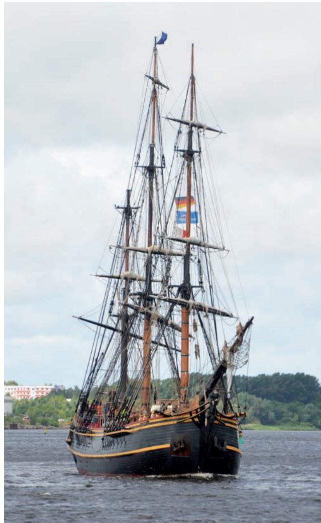
The "Bounty" invite you to Open-Ship on Sunday, from 11 a.m to 6 p.m.

Even in the run-up of the 21. Hanse Sail there was a lot of attention of the media for the replica of the 'Bounty' (USA), which was constructed 50 years ago for the movie 'Mutiny on the Bounty' (1962). The ship was announced for last Wednesday, but it came already on Tuesday. The NDR and Peter Marx of "Deutschlandradio" not only took the opportunity to interview the captain and the crew on board of