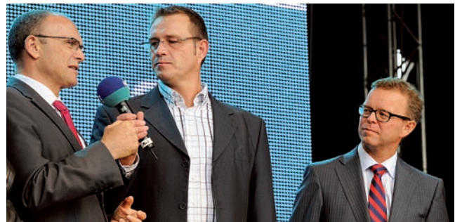
Bei der Eröffnung der 21. Hanse Sail