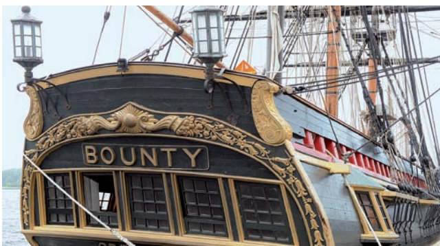
Die imposante Heckansicht der „Bounty“

Aber nicht nur Medien fühlen sich von der „Bounty“ magisch angezogen, sondern auch das Sail-Publikum. Am heutigen Sonntag gibt es noch einmal Open-Ship von 11.00 bis 18.00 Uhr.