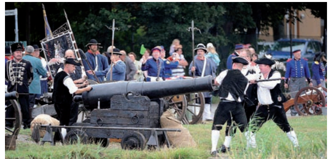
Kanoniere begrüßen die ankommenden Schiffe