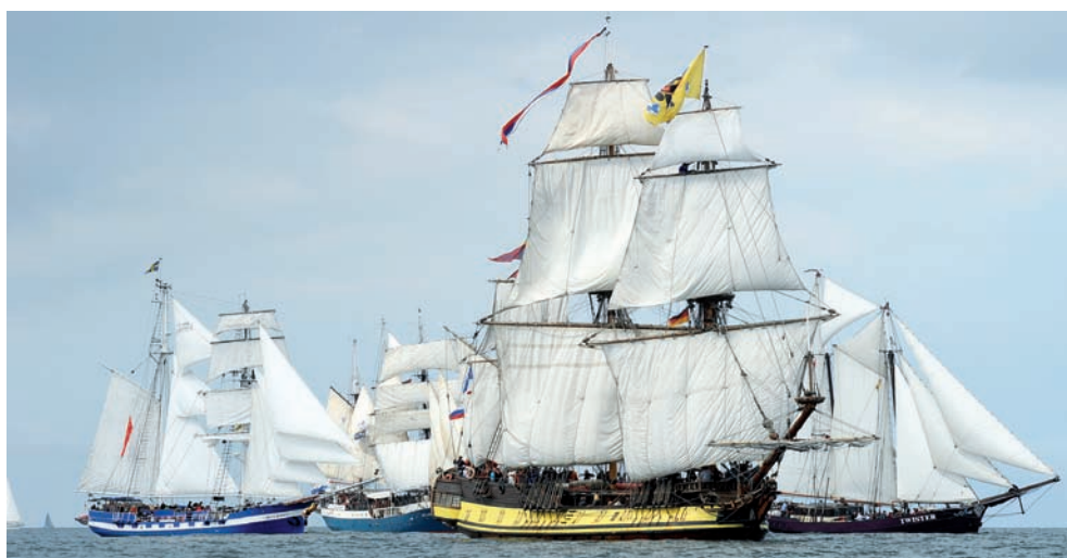
Sonniger Regattastart vor Warnemünde