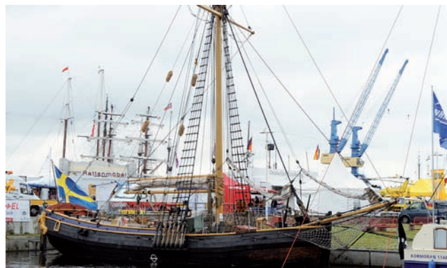
Schwedischer Postsegler „Hiorten“

Das Original, dem der 1998 fertig gestellte Nachbau eins