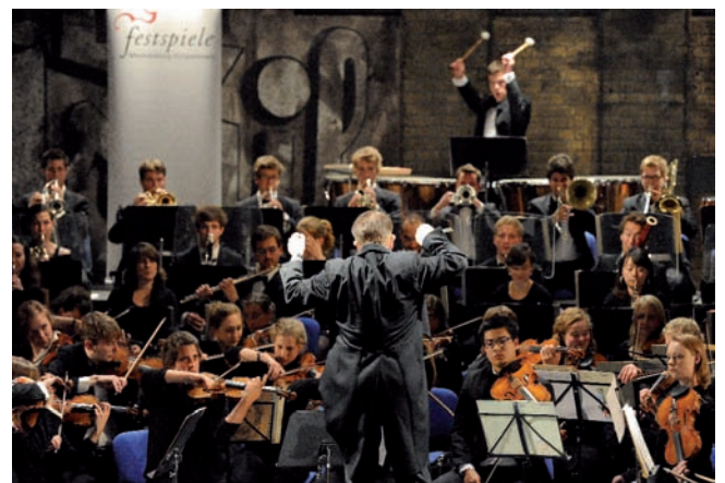
Emotionaler Auftakt am Vorabend der Sail-Eröffnung

Pate der Windjammer „Kruzenshtern“ und der „Sörlandet“.