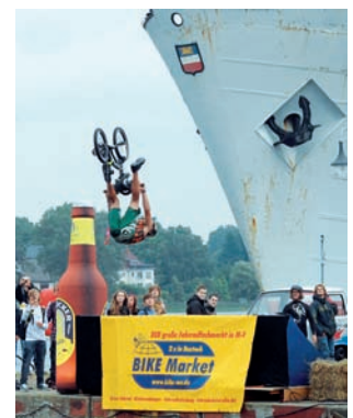
Rock the Ramp

über die Wasseroberfläche. Aber auch auf Bobby Cars, Skateboards, auf mit Rollen versehenen Bierkästen und anderen „Fahrzeugen“ wagen die Teilnehmer den Sprung ins kühle Warnow-nass. Eine prominent besetzte Jury bewertet die Sprünge in Fun-, aber auch Sport-Wettbewerben.