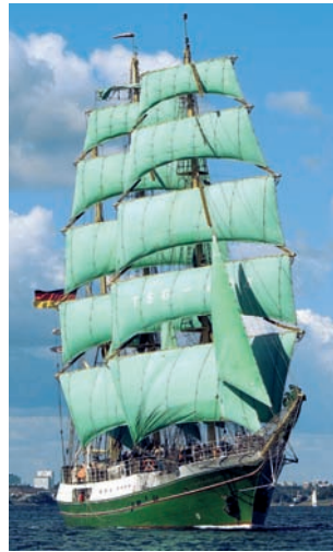
Die grüne Lady

Die Bark „Alexander von Humboldt“, das Schiff mit den grünen Segeln, ist auf ihrem Abschiedstörn und kommt dabei auch zur 21. Hanse Sail nach Rostock. Auf ihrer letzten Sommertour hat der Großsegler sich und den vielen Fans ein schönes Abschiedsgeschenk bereitet oder besser „ersegelt“.