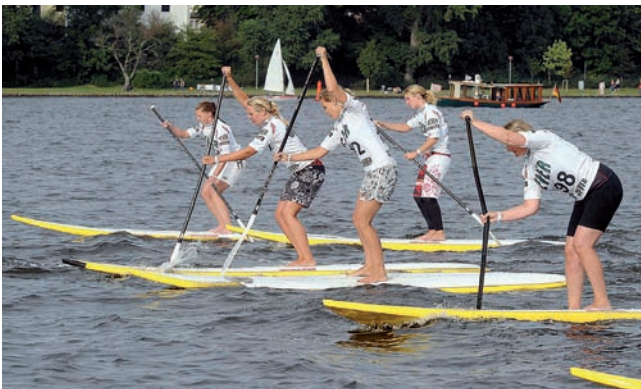
Stand Up Paddling im Segelstadion

nehmenden Nationen versammeln sich ab 19.00 Uhr im Stadthafen zur diesjährigen Parade der Nationen. Mittels einer Flagge am Heck, musikalischen Darbietungen und landestypischen Symbolen repräsentieren die Landesvertreter noch einmal die große Vielfalt des diesjährigen Teilnehmerfeldes.